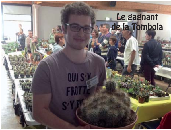
Le gagnant de la Tombola