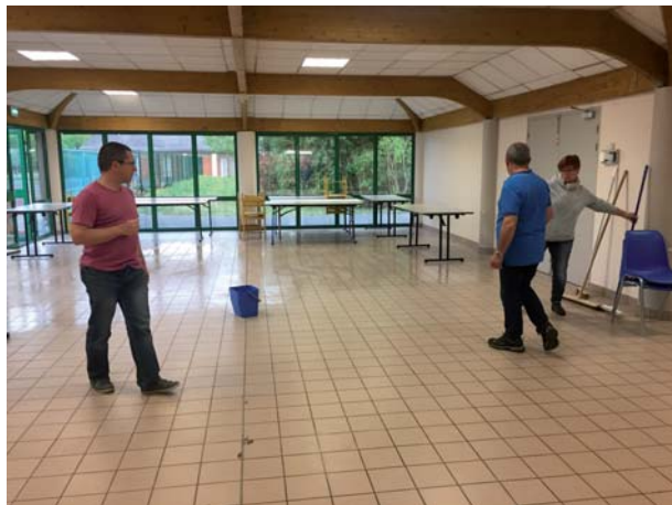
Tiercé vu par Alain Leraut "Les épines"